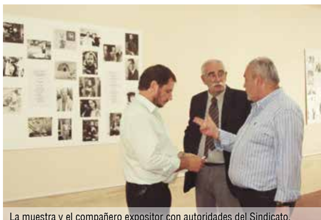
La muestra y el compañero expositor con autoridades del Sindicato.

Próximamente el Sindicato contará con un fondo de dinero para otorgar ayuda económica a los compañeros que la soliciten, poniendo de manifiesto y quedando al buen criterio de los afiliados que la referente ayuda es para caso de extrema necesidad, ya que serán sumas pequeñas para cubrir necesidad alguna en forma urgente. Para mayor información dirigirse al delegado del asentamiento.